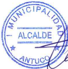
ALCALDE I. MUNICIPALIDAD DE ANTUCO

DÉCIMA SEGUNDA: El presente convenio se firma en cuatro ejemplares, quedando dos en poder de la Municipalidad, dos en poder del Servicio, y, uno en poder de la División de Presupuesto e Inversiones, Subsecretaría de Redes Asistenciales del Ministerio de Salud.