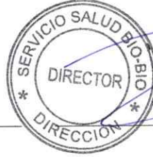
DIRECTOR SERVICIO DE SALUD