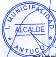
SANDRA BOBADILLA CISTERNA ALCALDESA