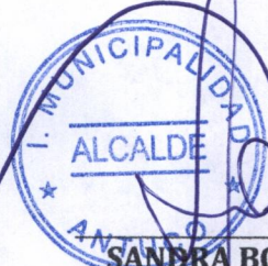
SANDRA BOBADILLA CISTERNA ALCALDESA