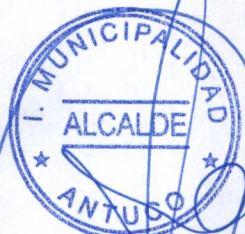
SANDRA BOBADILLA CISTERNA ALCALDESA