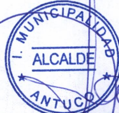
SANDRA BOBADILLA CISTERNA ALCALDESA