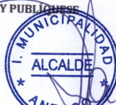
SANDRA BOBADILLA CISTERNA ALCALDESA