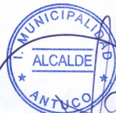
SANDRA BOBADILLA CISTERNA ALCALDESA