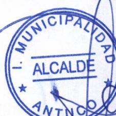
SANDRA BOBADILLA CISTERNA ALCALDESA