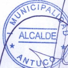
SANDRA BOBADILLA GISTERNA ALCALDESA

SBC/NVA/VHM/RTM/EJC/ESL/CFB/mic DISTRIBUCIÓN: