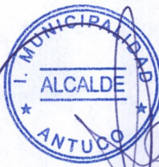
SANDRA BOBADILLA CISTERNA ALCALDESA