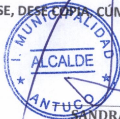
SANDRA BOBADILLA CISTERNA ALCALDESA