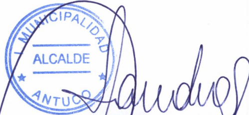
SANDRA BOBADILLA CISTERNA ALCALDESA