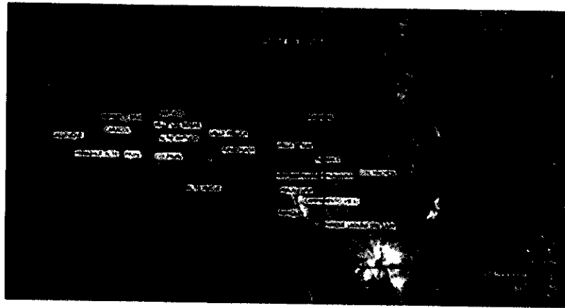
Imagen 5: Mapa localidades Antuco.