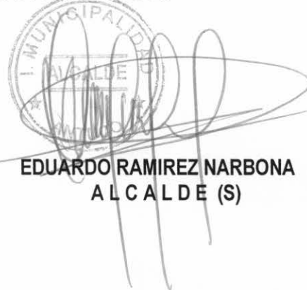
EDUARDO RAMIREZ NARBONA ALCALDE (S)