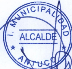
SANDRA BOBADILLA CISTERNA ALCALDESA